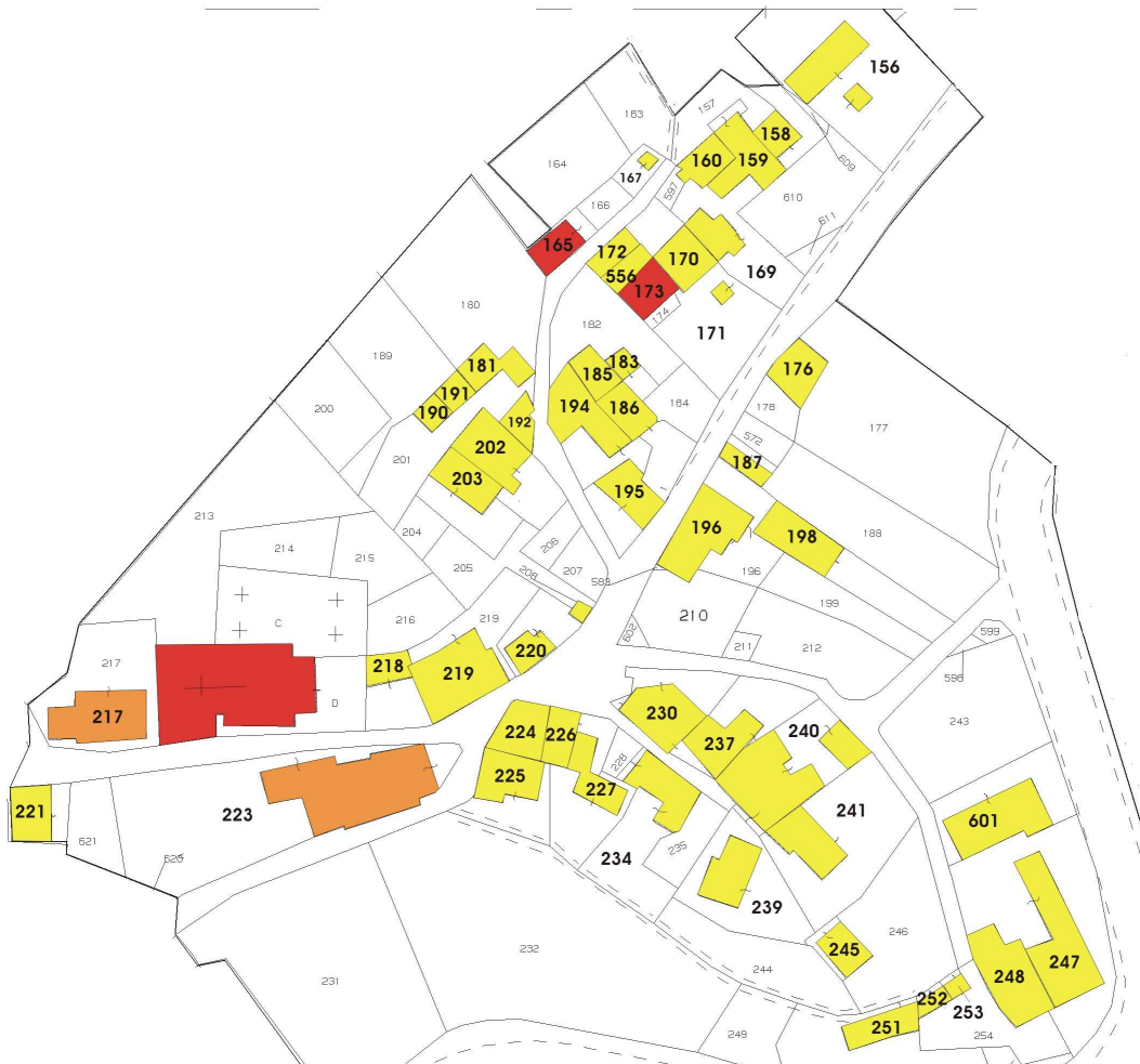
Stralcio di mappa catastale